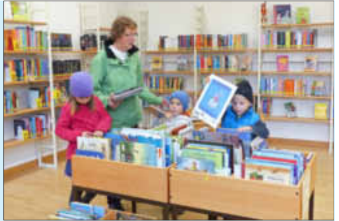
Unsere kleinen Leser finden in den Bücherkisten tolle Bilderbücher.