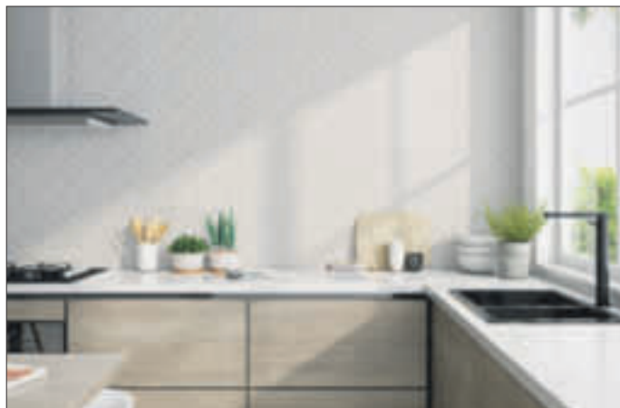
Die Wandfliesen, hier mit floraler Optik, wirken durch die Art der Verlegung wie eine einzige große Fläche.

Edle Arbeitsplatten aus spanischen Fliesen für höchste Ansprüche