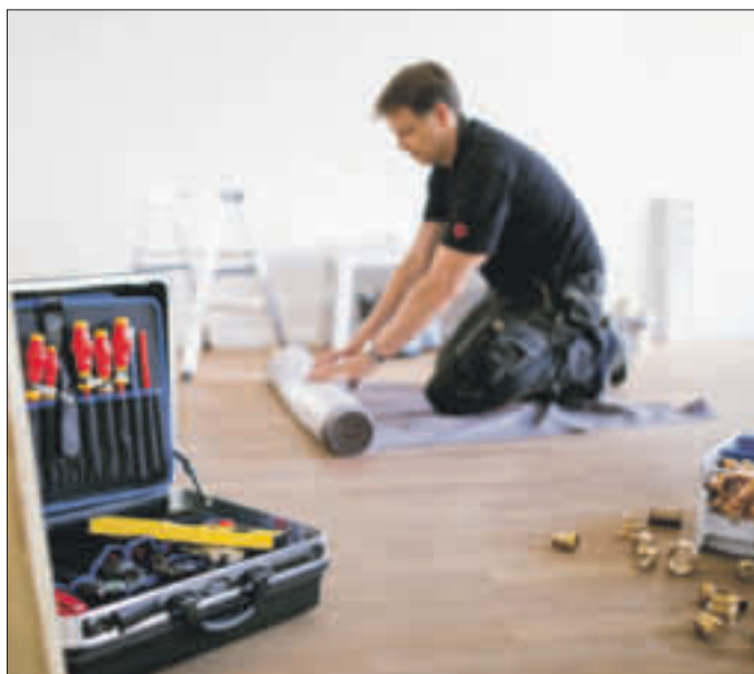
So geht Handwerk heute: Mit modernster Arbeitstechnik planen und installieren Fachkräfte effiziente Heizungsanlagen, mit denen sich bis zu 30 Prozent CO 2 -Ausstoß einsparen lassen.

Planungs-Apps, die mit der Zentrale verbunden sind. So kann sich der Installateur voll auf seine Kernkompetenz – den fachgerechten Ein- und Ausbau der Heizungsanlage – konzentrieren.