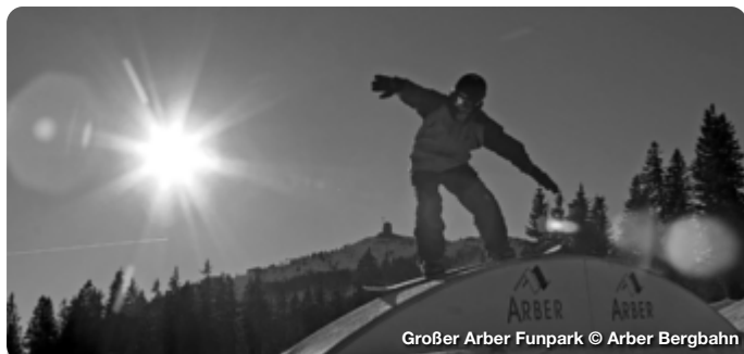
Großer Arber Funpark

Auf Grund von Corona sind alle Termine und Angaben unter Vorbehalt!