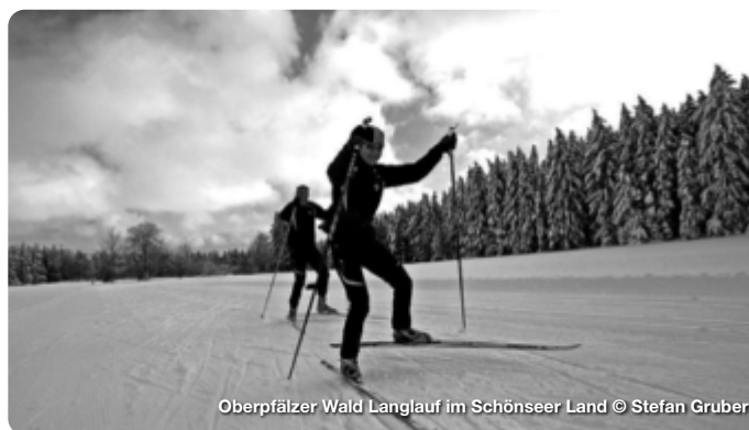
Oberpfälzer Wald Langlauf im Schönseer Land