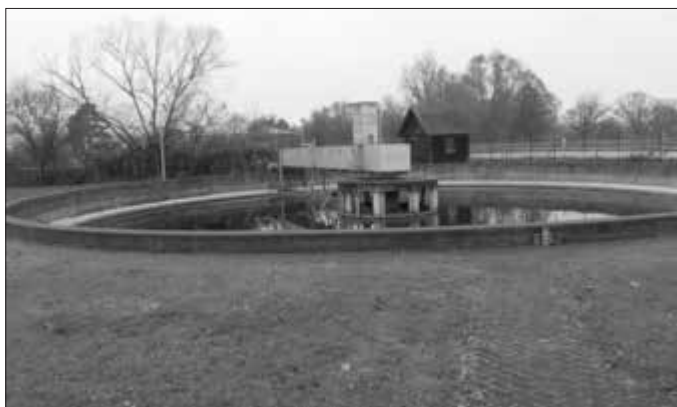
Veolia unterstützt den Markt Zapfendorf in Sachen Daseinsvorsorge und betreibt nun die Abwasseranlagen. Hier im Bild die Kläranlage in Zapfendorf.

Die Veolia Gruppe ist der weltweite Maßstab für optimiertes Ressourcenmanagement. Mit über 179 000 Beschäftigten auf allen fünf Kontinenten plant und implementiert die Veolia-Gruppe Lösungen für die Bereiche Wasser-, Abfall- und Energiemanagement im Sinne einer nachhaltigen Entwicklung der Kommunen und der Wirtschaft.