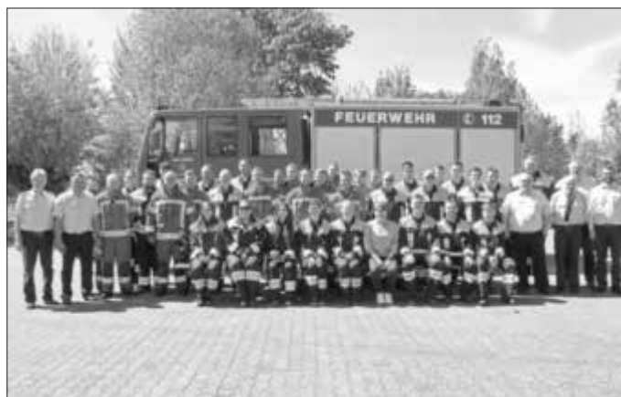
Am zweiten Prüfungstag: Fünf Gruppen mit Teilnehmenden der Freiwilligen Feuerwehren Lauf, Sassendorf, Zapfendorf, Unterleiterbach und Windischletten zeigen beeindruckende Leistungen.