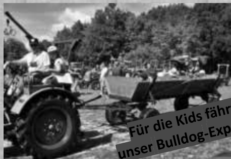
Für die Kids fährt unser Bulldog-Express