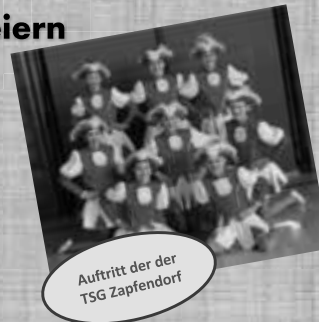
Auftritt der TSG Zapfendorf

ab 14 Uhr auf dem Zapfendorfer Festplatz