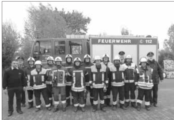
Am ersten Prüfungstag: Aktive der Freiwilligen Feuerwehren Ebing, Zapfendorf, Windischletten und Oberleiterbach meistern die THL-Leistungsprüfung.