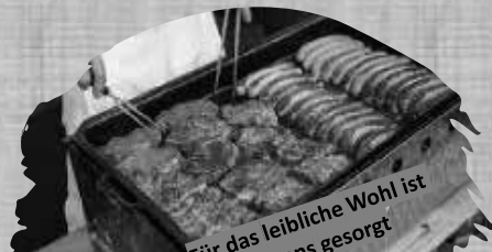
Für das leibliche Wohl ist bestens gesorgt