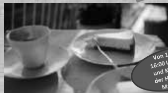
Von 14:00 bis 16:00 Uhr Kaffee und Kuchen aus der Hausfrauen-Manufaktur