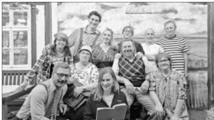
Gruppenfoto der Theatergruppe am letzten Aufführungstag.