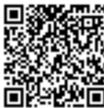
Code für Übersichtsplan

Am Sonntag, den 07.04.2024 von 13 – 17 Uhr in Lauf (96199 Zapfendorf)