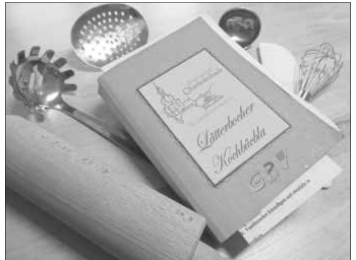
„Soll etwas Besonderes sein“: Für das Lätterbocher Kochbüchla werden noch Rezepte gesucht.