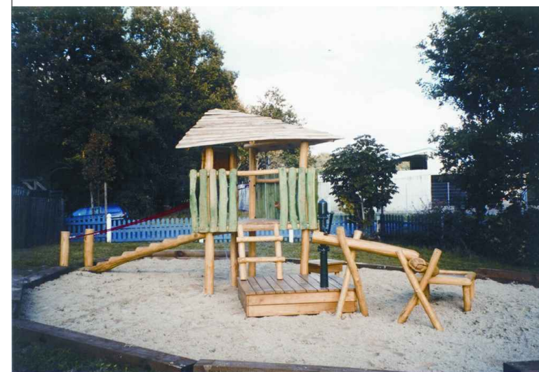
Sand- und Matschspiel