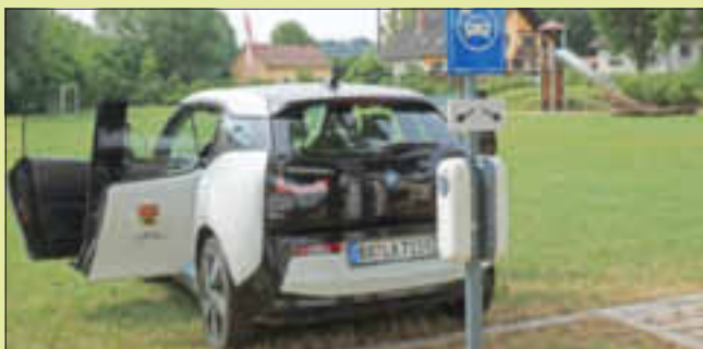
In Oberleiterbach steht jetzt eine Ladesäule für E-Autos zu Verfügung.

und hofft nun auf Gold im Landesentscheid. Der nächste Schritt wäre dann 2019 der Entscheid auf Bundesebene. Dafür drücken wir Oberleiterbach fest die Daumen!