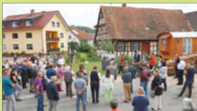
Hier entsteht das Dorfcafé Oberleiterbach. Zahlreiche Interessierte begleiteten die Landes-Kommission auf ihrem Rundgang durch das Dorf.