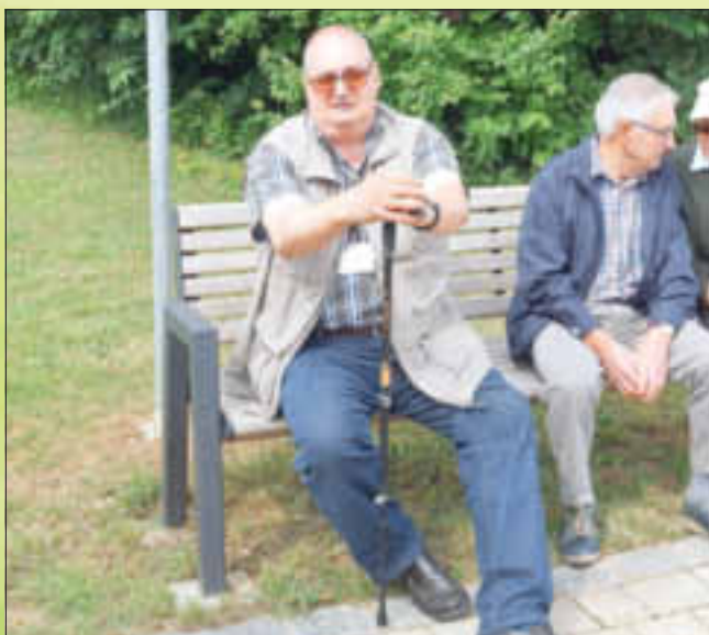
Wer auf dem „Mitfahrbänkle“ sitzt, kann sich in Zukunft von vorbeifahrenden Autofahrern mitnehmen lassen.