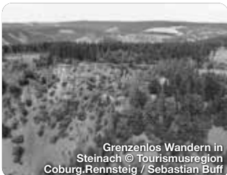
Grenzenlos Wandern in Steinach

Der Landkreis Sonneberg, gelegen im Herzen des malerischen Thüringer Waldes, ist eine wahre Schatzkammer für Naturfreunde, Handwerkbegeisterte und Erholungssuchende gleichermaßen. Die Spielzeugstadt Sonneberg, weltbekannt für ihre lange Tradition in der Spielzeugherstellung, begeistert Besucher mit ihrem Deutschen Spielzeugmuseum, dem Deutschen Teddybärenmuseum und einer Vielzahl von Attraktionen rund um das Thema Spielzeug. Das historische und bis heute ansässige Glashandwerk ist eher im Norden des Landkreises in und um Lauscha zu finden. Dort wurde übrigens auch die Gläserne Christbaumkugel erfunden! Bis heute werden viele wunderschöne Unikate aus Glas in vielen kleinen Manufakturen und Hütten gefertigt. TreffpunktDeutschland.de/sonneberg-region