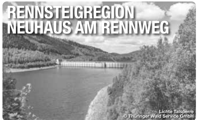
Lichte Talsperre

Heute erinnert das Deutsche Schiefermuseum an die 400jährige Geschichte der Griffelproduktion. Dr.-Max-Volk-Str. 21, Steinach