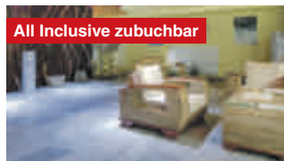
All Inclusive zubuchbar

Kurtaxe: ca. 2,10 € p. P./N. Auch 7 Nächte sowie weitere Termine 2024 buchbar.