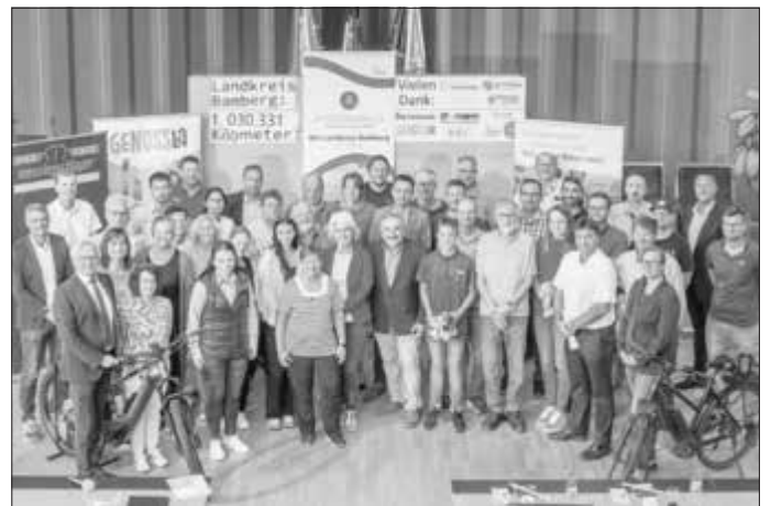
Die glücklichen Preisträger beim diesjährigen STADTRADELN.

Weitere Informationen finden Sie unter https://www.landkreis-bamberg.de/stadtradeln/