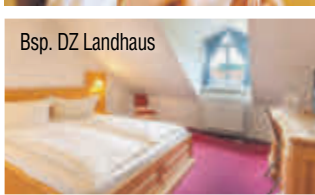
Bsp. DZ Landhaus