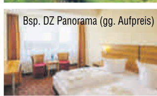
Bsp. DZ Panorama (gg. Aufpreis)