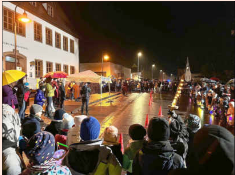
St. Martinsumzug der Kita St. Franziskus in Zapfendorf