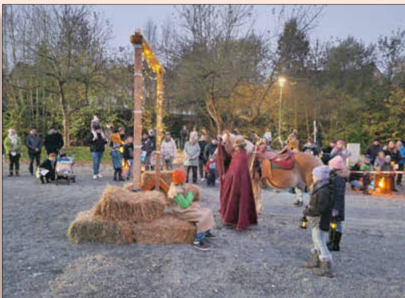
St. Martinsumzug in Lauf