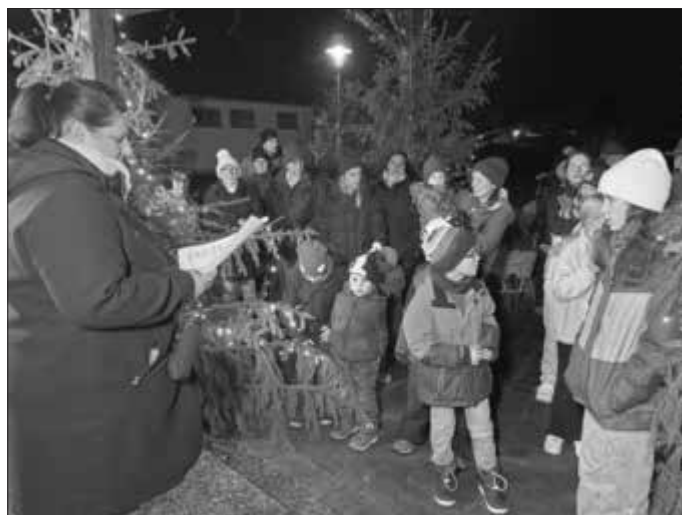
Zur Einstimmung wurde das ein oder andere Liedchen gesungen.

Das Christkind aber wollte herbeigesungen werden, und so stimmten die Kinder und Erwachsene auf dem winterlich und weihnachtlich dekorierten Platz vor dem Gemeinschaftshaus erst einmal ein Weihnachtslied an. Schon schwebte das Christkind im weißen Gewand herbei. Die Zuschauerinnen und Zuschauer hatten derweil einen Halbkreis gebildet, lauschten andächtig den Worten des besonderen Gasts mit Flügelchen. Dann gab es für die Kleinen und Kleinsten natürlich die ersehnten Päckchen mit allerlei Genussvollem.