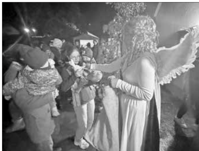
In Vertretung des Nikolauses: Das Christkind verteilt bei der Dorfweihnacht fleißig Geschenke.

Allgemein stand das Schlemmen und Genießen bei der Neuauflage der Dorfweihnacht des Gartenbauvereins zweifelsohne im Mittelpunkt. Das fing beim selbstgemachten Glühwein an, setzte sich über Hot Aperol und Lumumba fort und endete beim beliebten Schlemmerbrötchen. Gekommen