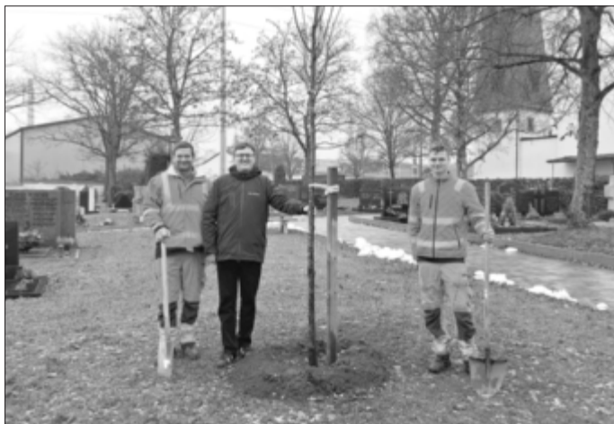
Pflanzung am Friedhof in Zapfendorf.

Dank unserer fleißigen 179 Radlerinnen und Radler beim STADTRADELN 2025 bekam der Markt Zapfendorf vom Landkreis Bamberg insgesamt 5 Bäume geschenkt.