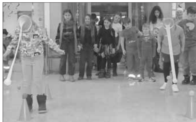
Kam tierisch gut an: Das Elefantenkegeln.

Am Stimmungsbarometer gab es keinerlei Zweifel: Zauberer und Superman, Fee und Ninja, Piratin und Sheriff, Harry Potter und Cowgirl hatten „vorne gute Laune, hinten gute Laune“ und gaben von Anfang an Vollgas beim Kinderfasching im großen, bunt geschmückten Saal des Gemeinschaftshauses Oberleiterbach. Die kleinen Narren waren mit ihren Eltern und Großeltern längst nicht nur aus dem Dorf, sondern auch aus den Orten drumherum gekommen. Während es draußen dicke Tropfen regnete, regnete es innen leckere Süßigkeiten – und natürlich gab es Toben, Tollen, Tanz und Spiele, um das Laune-Level ganz oben zu halten.