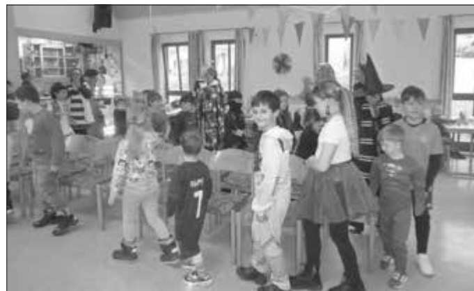
Stuhlpolonaise: Eine „Reise nach Jerusalem“ darf bei keinem Kinderfasching fehlen.

Wie kegelt ein Elefant? Richtig, mit dem langen Rüssel. Dass das gar nicht so einfach ist, erfuhren die Faschingsfreunde am Rosenmontag am eigenen Leib: Ein Nylonstrumpf auf dem Schopf diente als Rüsslersatz, ein Tennisball am Ende sorgte dafür, dass der die Elefanten-Extremität auch schön schwingen konnte – und schon ging es los mit dem lustigen Spiel. Wer eher Schlangenfrau denn Elefantenimitator war, kam beim Limbo voll auf seine Kosten.